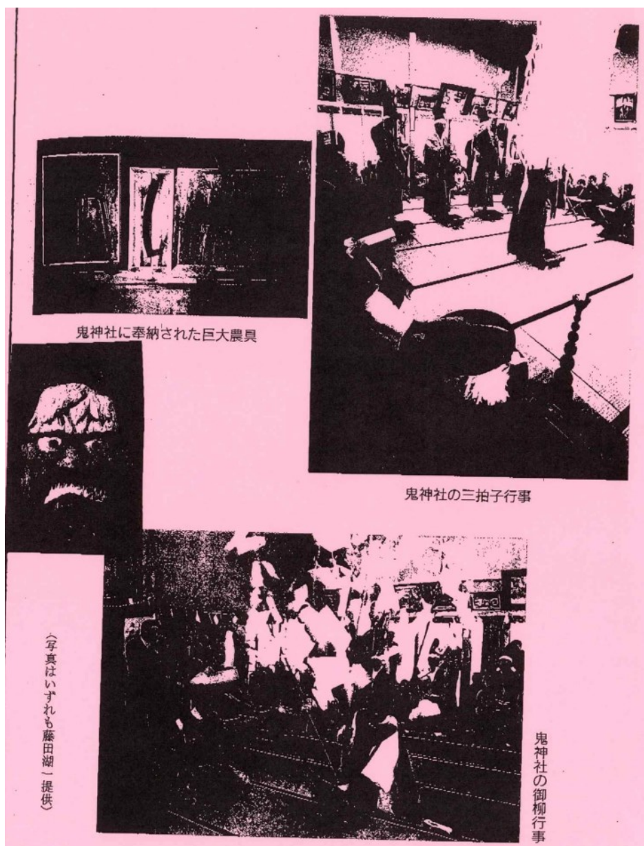
図 2 鬼沢の伝承